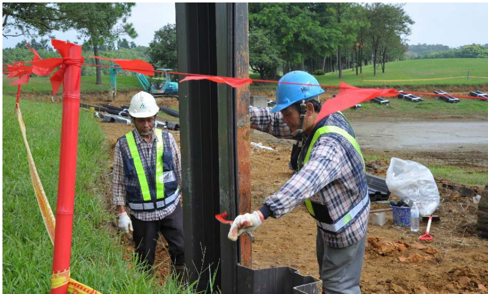
步驟七：拿開 C 型夾