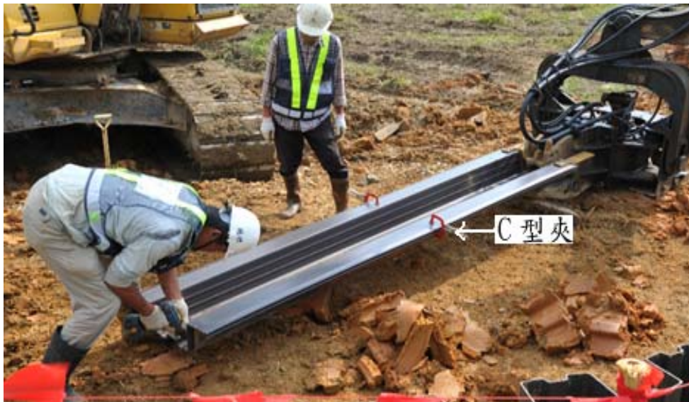
步驟三：中段以 C 型夾固定