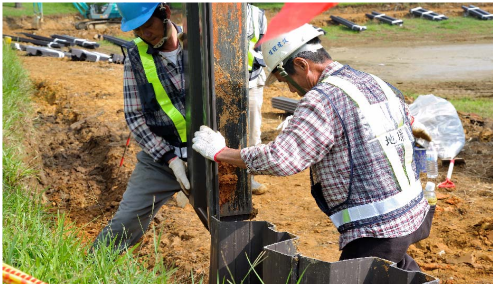
步驟五：板樁吊起並對準前樁套合