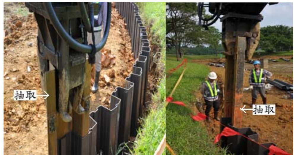
步驟十：抽取鋼板導樁