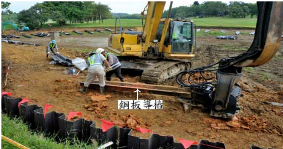
步驟一：鋼板導樁安置