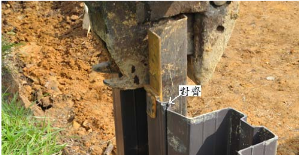
步驟九：板樁打入與前樁對齊